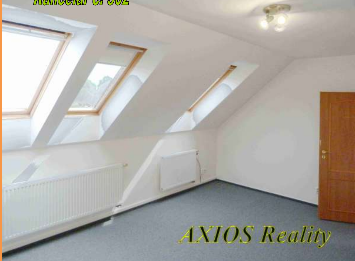
Kancelář č. 302